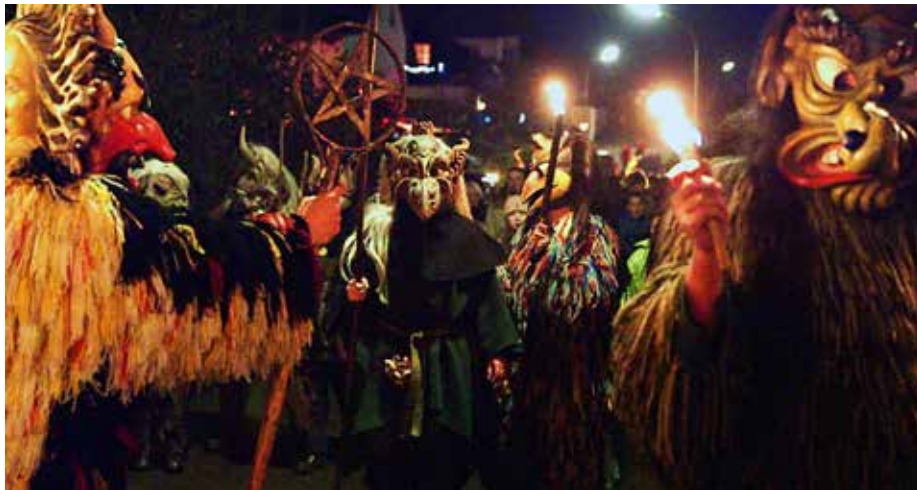
Der Bayerische Rundfunk berichtete am 07.12.2014 mit dem Titel „Der Spuk der langen Nächte“ aus der Umgebung von München. Auch bei uns dominierten in den 12 Rauhnaechten Angst, wenn mystische Gestalten die Gedanken der Menschen lähmten und sie sich hilflos ausgeliefert fühlten. http://www.br.de/br-fernsehen/sendungen/abendschau-der-sueden/perchten-rauhnaechte-brauchtum-100.html

Das Licht ließ man den ganzen Tag brennen, um Geister zu hindern, im Hause Fuß zu fassen. Er galt als die gefährlichste Rauhnaecht, in der die Perchten besonders wüten durften. Von den Bräuchen blieb das Stärkeantrinken, wo jeder in der Familie, auch Kinder, früher zu Hause nüchtern ein Gläschen Schnaps trank. Ihm wurde eine große Zauber- und Heilkraft zugeschrieben und der in der Flasche verbleibende Rest an Schnaps wird der Mutter sorgfältig für alle Krankheiten aufbewahrt. Auch sollten am Obersten alle Familienmitglieder baden, um sich vor Hautunreinheiten im neuen Jahr zu schützen.