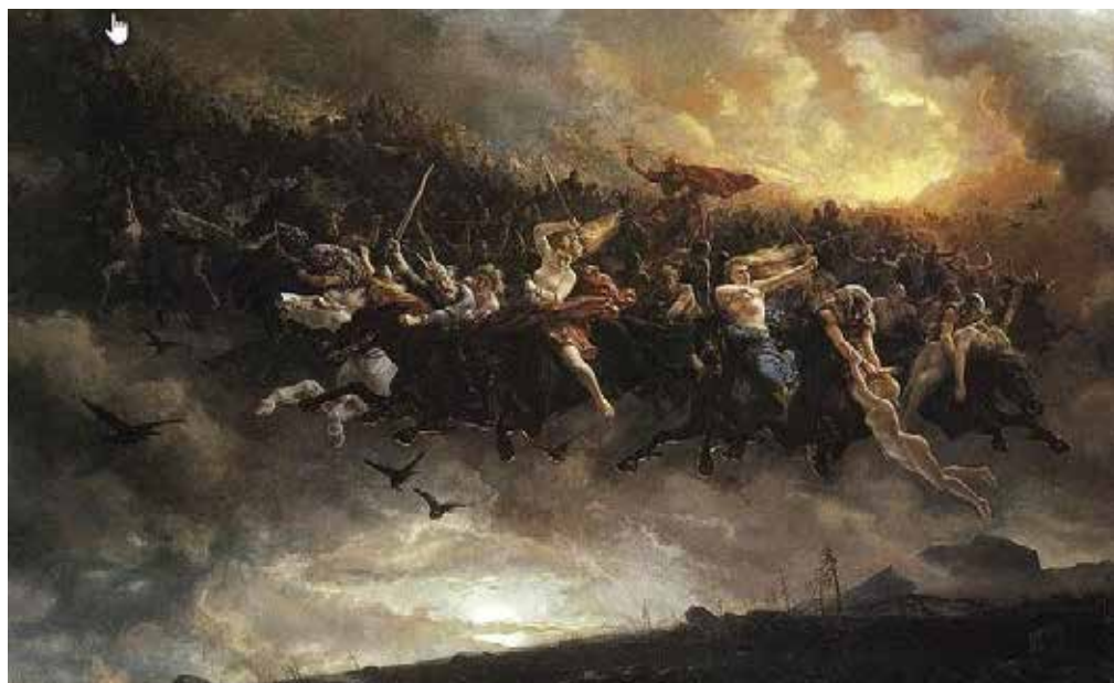
„Odins wilde Jagd“ des norwegischen Malers Peter Nicolai Arbo (1872)

Der Andreastag, der 30. November, galt von alters her als Losnacht (Los in der Bedeutung von Schicksal), in der man gern die Zukunft befragte. Auch wenn dieser Brauch heidnischen Ursprungs war, war es doch interessant, wenn Verliebte einen Pantoffel rückwärts gegen die Tür warfen. Blickte die Spitze gegen den Eingang, so war bald mit einem Freier zu rechnen. Der Barbaratag am 4. Dezember ist noch eher in Erinnerung, wenn man Kirsch-, Schlehdorn- oder Fliederzweige in lauwarmes Wasser stellte. Nur dann werden die noch kahlen Äste zum Christfest erblühen und bringen sicherlich Glück in der Liebe und Fruchtbarkeit im Stall und auf dem Feld.