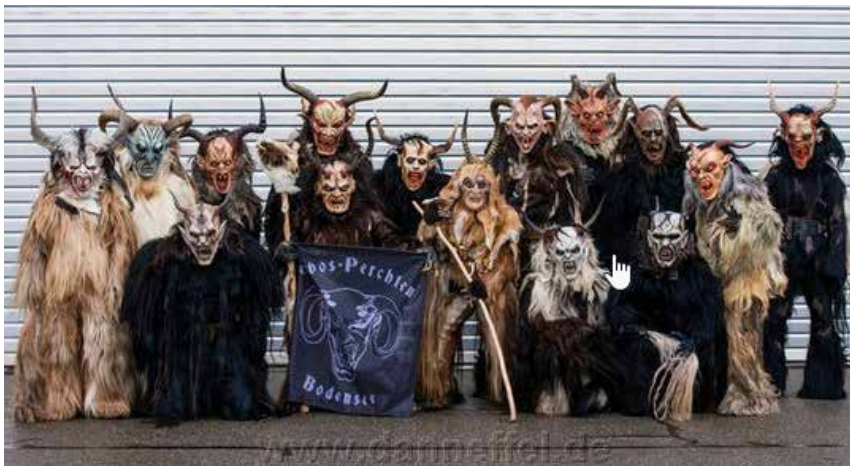
In Österreich und im Allgäu laufen in den Rauh Nächten als Perchten verkleidete Burschen durch das Dorf ( http://www.erebos-perchten-bodensee.de/ ). Bei uns in Oberfranken ist diese Erinnerung an frühere Zeiten in Vergessenheit geraten.

Das Spinnrad stand still, ansonsten wurden die Mädchen von der Berchta bestraft, Flicker und Nähen bedeuteten Unglück. An diesen Zwölften ruhten alle Fehden. Indem man verschiedene Gebote beachtete, hielt man die Schreckensgestalten von Leib und Seele, von Haus und Hof fern. Jede Tätigkeit, die eine Drehbewegung voraussetzte, war verboten. Kein Bauer drosch Korn, fahren mit dem Schlitten war erlaubt, aber nicht mit dem Wagen. Es wurde kein Brot gebacken, sonst brennt im folgenden Jahr das Haus. Es durfte keine Wäsche gewaschen werden, besonders Bettwäsche, ansonsten wird man im kommenden Jahr aus seinem Haus einen Toten tragen. Man durfte weder die Haare noch die Fingernägel schneiden, sonst erlebt man eine schwere Krankheit. Strümpfstopfen war verpönt. Mit dem Gebetläuten ruhte fast jede Tätigkeit, denn dann begann der dämonische Geisterspuk.