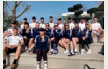
VFL - ABTEILUNG TENNIS