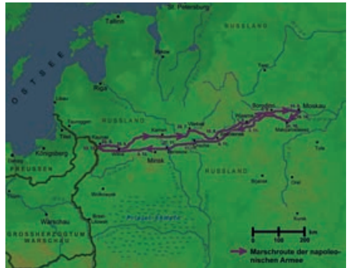
Grafik des Feldzuges im Jahre 1812

Diesen Gefallen taten ihm jedoch der Zar und sein Generalstab nicht. Deren Verzögerungstaktik mit sporadischen Angriffen und dem Prinzip der „verbrannten Erde“, die klimatischen Bedingungen und die Weite des Landes mit spärlicher Besiedelung sowie daraus resultierende logistische Schwierigkeiten setzten Napoleons Armee schwer zu. Erst am 7. September 1812 kam es bei den Schanzen des Dorfes Borodino, etwa 115 Kilometer westlich von Moskau, zu einer blutigen Entscheidungsschlacht, bei der es auf beiden Seiten hohe Verluste, aber keinen wirklichen Sieger gab. Die Russen zogen sich danach zurück, um sich im Hinterland von Moskau zu sammeln und neu aufzustellen. Napoleon konnte somit ohne weitere Kampfhandlungen Moskau einnehmen, das kurz zuvor in einem Großbrand aufging. Auf angebotene Waffenstillstands- bzw. Friedensverhandlungen reagierte der russische Zar nicht. Weil seine Armee für den Winterkampf nicht ausgestattet war – da-