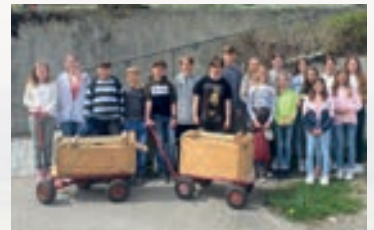
RÄTSCHEN DER MINISTRANTEN